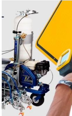
ALQUILER Y VENTA DE MAQUINARIAS Y EQUIPOS