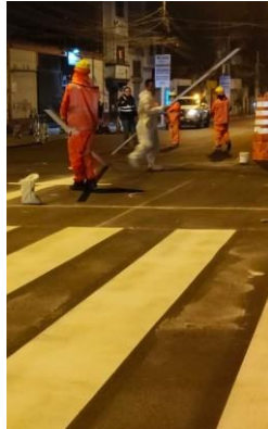
CONSERVACIÓN Y MANTENIMIENTO VIAL