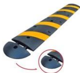
GIBA O ROMPEMUELLES DE PVC