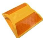
TACHAS Y TACHONES VIALES