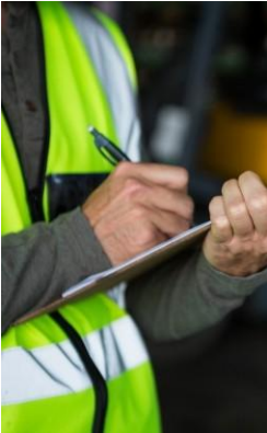
CONSULTORÍA EN INGENIERÍA VIAL