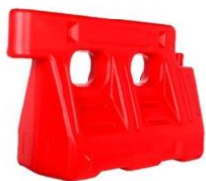
CANALIZADORES NEW JERSEY