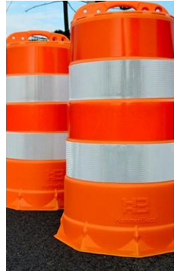
VENTA DE PRODUCTOS DE SEGURIDAD VIAL